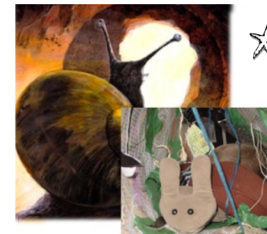
Il traverse un tunnel lugubre.

○ Mettre en scène un récit en suivant la trame d'un album.