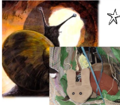
Il traverse un tunnel lugubre.

○ Mettre en scène un récit en suivant la trame d'un album.