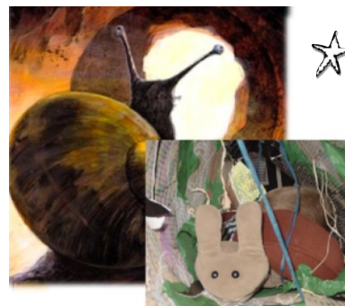
Il traverse un tunnel lugubre.

○ Mettre en scène un récit en suivant la trame d'un album.