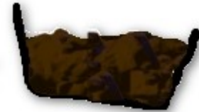
un pot de terre